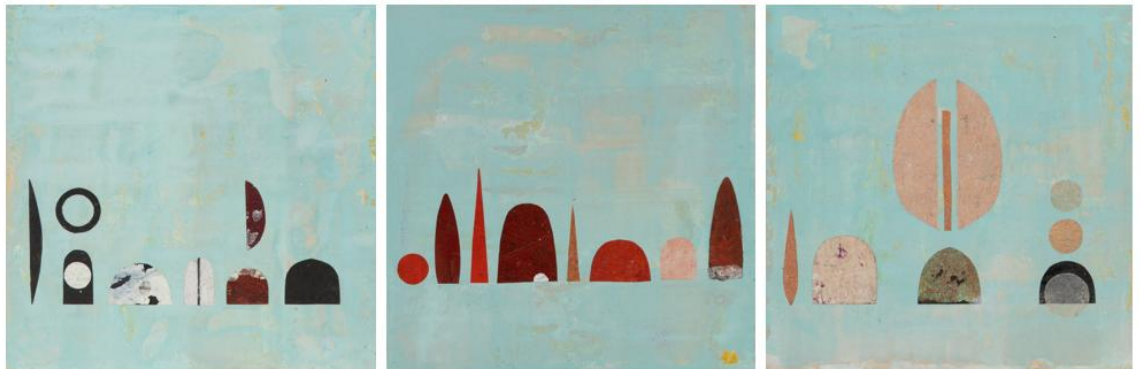
Meine Seele findet Heilung