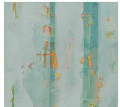
Ich trenne mich